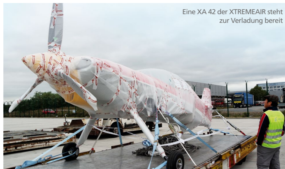
Eine XA 42 der XTREMEAIR steht zur Verladung bereit