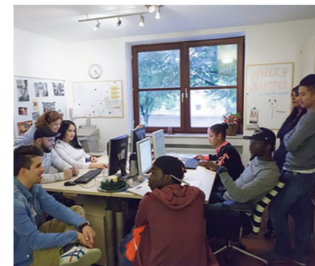
Gemeinsame Projektarbeit der Jugendlichen

GROUP7 unterstützt seit Jahren sozial benachteiligte Kinder und Jugendliche